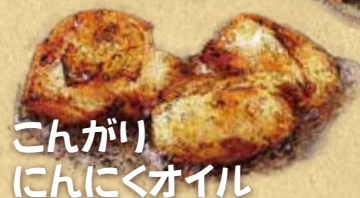
こんがり んにくオイル