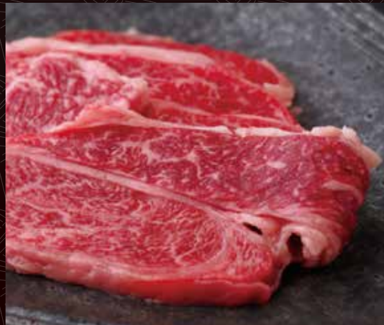
한덩어리 반 1인분 로스 400원 / 790원 / 1,500원