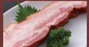
미야자키 완속 돼지의 진짜 베이컨