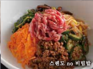
스텐도 no 비빔밥