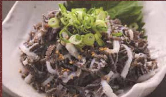
생 천엽 600 円