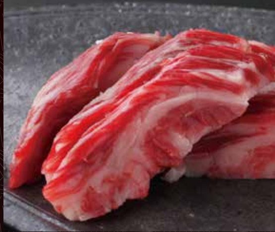
한덩어리 반 1인분 만노식 갈비 260원 / 520원 / 980원