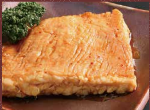
호쾌 샌드 구이 소 (약200g) 1,580 원 대 (약400g) 2,900 원

특제 양념에 꼭 채운 통고기는 탱탱한 씹는 맛과 독특한 지방의 맛이 일품입니다.