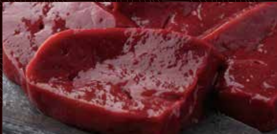
매우 신선한 레바(간)