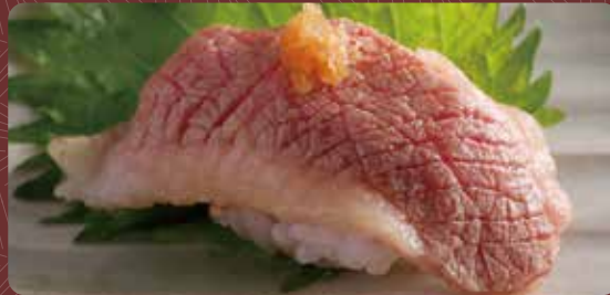
소 가슴살 구이 초밥 1개분 350円