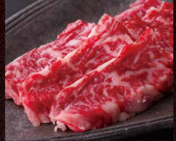
한덩어리 반 1인분 갈비 290원 / 580원 / 1,100원