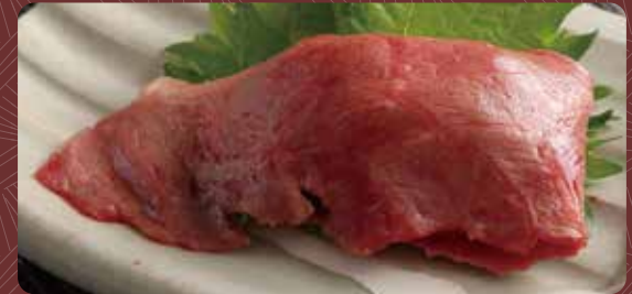
치마키 아부리 1개분 350円