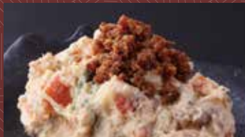
남자의 감자 샐러드