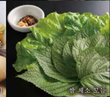
쌈 채소 모듬