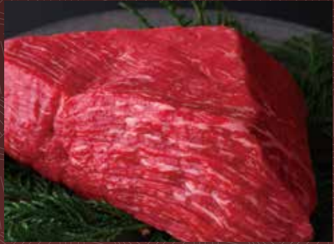
고쿠멘 아카미 통구이 (달아서 삶) 10g 140 원