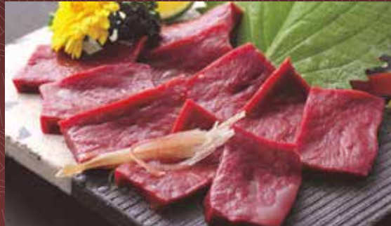
코코로 사시미 600 円