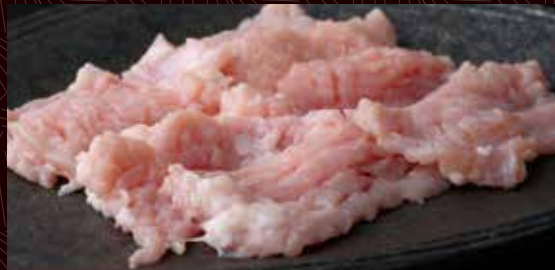
미노(제 1 위주머니)