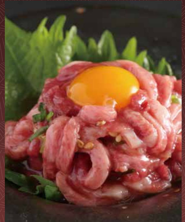
소혀 육회 1,500 円