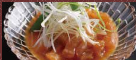
아킬레스(소의 힘줄)의 뒷장 조림