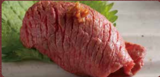
아카미 구이 초밥 1개분 350円