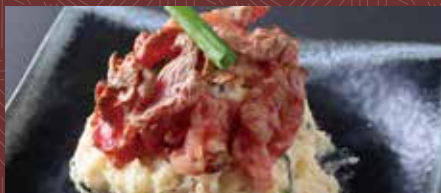
만노야 스페셜포테토 샐러드