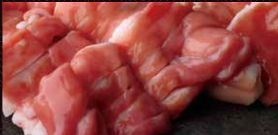
아카센(막창) (제 4 위장)