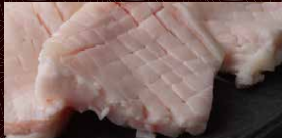
하라미스지 (형격막 근육)