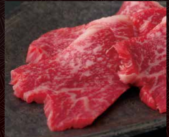
한덩어리 반 1인분 조아카미 420원 / 840원 / 1,600원

※이 페이지의 모든 상품은, 1인분은 4점, 반은 2점이제공됩니다. ※ 표시 가격은 모두 세금 별도 가격입니다.