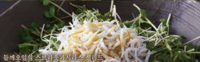
들깨오일의 스프라웃과시라스 샐러드