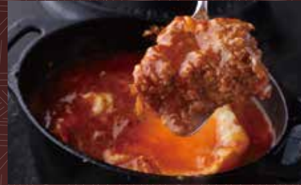
와규 츠쿠네 함바그