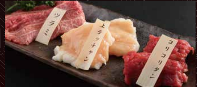
쪼 호르몬 모듬 (3종) 1,900 円 (반 1,000 円)