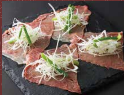
극암소구이파초 850 円