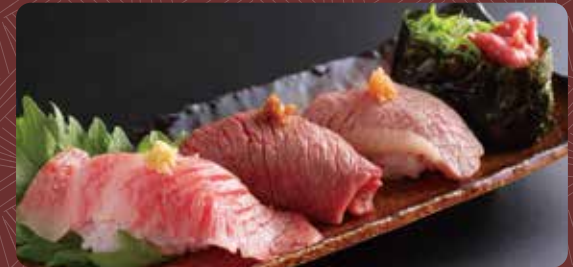
구운 고기 초밥 모듬(4개) 1,400円