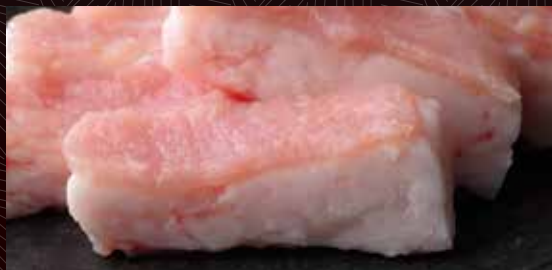
미노산도(제 1 위장)