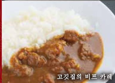
고깃집의 비프 카레