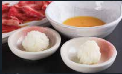
[미니사이즈 밥 포함]

얇게 썬 고기를 망 전체에 펴서, 한쪽 면을 5초 정도 가볍게 구우면 OK!! 특제 다시가 들어간 계란에 적어서 드십시오. 그리고, 미니사이즈 밥도 있으니, 남은 계란에 넣어서 마지막까지 즐기십시오.