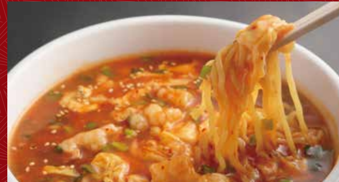
하드룩 누들 950원