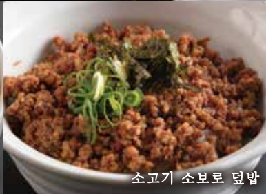
소고기 소보로 덮밥