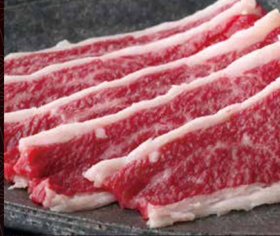
한덩어리 반 1인분 부리스케 270원 / 530원 / 1,000원