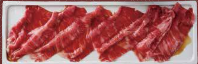
아카미 (살코기) (모모) 1,400원

가슴의 늑골부분의 고기입니다. 얇게 썰기 때문에 살코기와 적당한 지방분이 맛을 좋게 합니다.