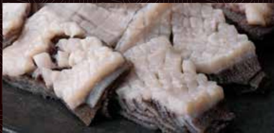
센마이(천엽) (제 3 위장)