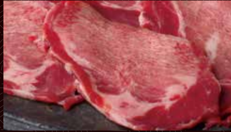
쪼탄 (미국) 한덩어리 290 円/반 580 円/1인분 1,100 円