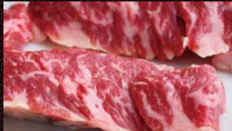
하라미 (안창살) (미국산·프라임) 한덩어리 270 円/반 530 円/1인분 1,000 円