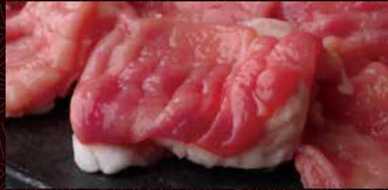
조아카센(특막창) (제 4 위장)