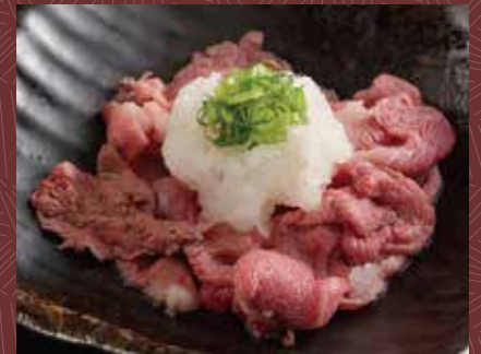
치마키 유부리 다이콩(무) 오로시 1,000 円