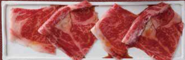
5. 리브 로스 1,900원

고기의 넓적다리 부분입니다. 철분이 풍부하고 지방질이 적어 다이어트에 좋습니다.