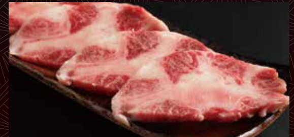
뼈있는 꼬리 (꼬리)