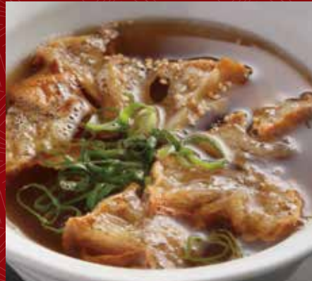
아부라카스 스프 500원