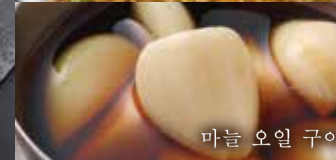
마늘 오일 구이