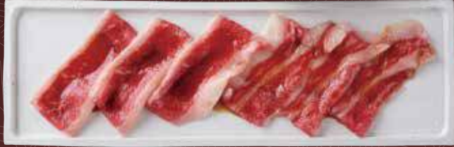
부리스케 (소 가슴살) (앞양지) 1,100원

팔과 다리의 스키 부분의 고기입니다. 맛이 응축되어 탄력성이 풍부한 고기입니다.