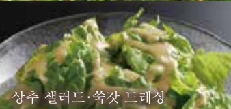
상추 샐러드·썩갓 드레싱