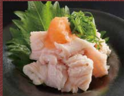
국산 미노 유비끼 폰즈 650 円