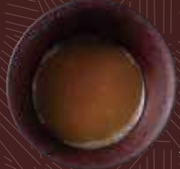
다시 국물이 들어간 계란