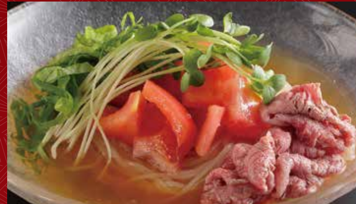
고기 토핑 샐러드 냉면 1,000원