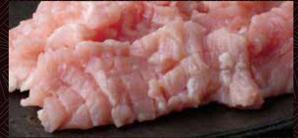
조미노(특양) (제 1 위장)