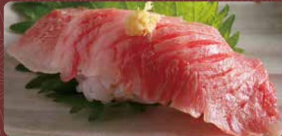
소 토로 구이 초밥 1개분 450円