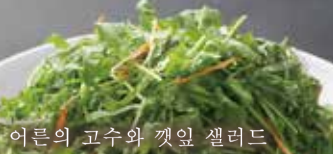
어른의 고수와 깻잎 샐러드