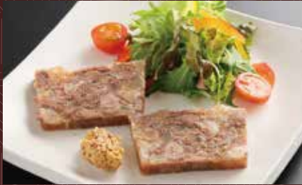
소 꼬리고기와 스킨니꾸의 테린느