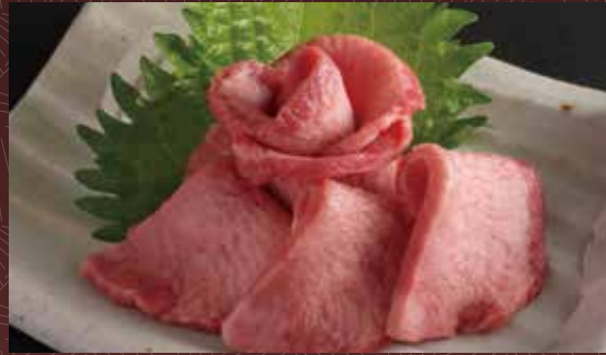
소혀의 사시미 1,700 円