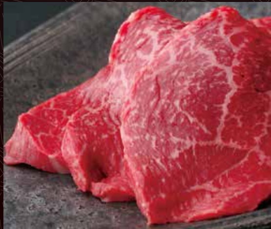
한덩어리 반 1인분 아카미 340원 / 680원 / 1,300원 (살코기)