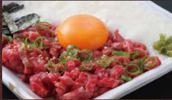
고쿠멘 와규 츠키미 토로로 스텐도 1,000 円