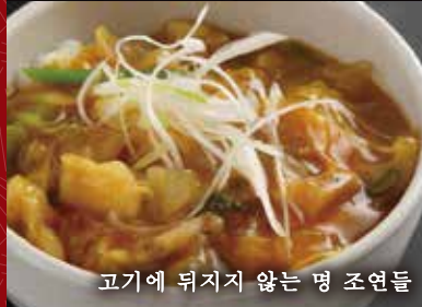
고기에 튀지지 않는 명 조연들