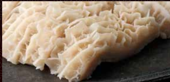
하치노스(소별집) (제 2 위장)