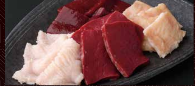
그날의 호르몬 (내장) 모듬 (4종) 1,900 円 (반 1,000 円)