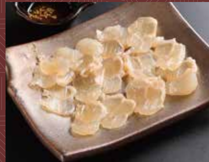
아킬레스(소의 힘줄) 사시미 500 円