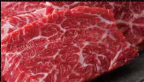
비와하라미 (토시살) (황경막 부위) 한덩어리 420 円/반 840 円/1인분 1,600 円