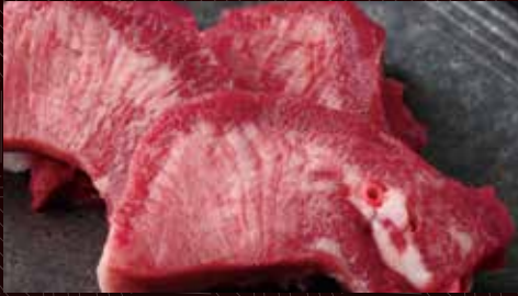
두툽한 우설 (미국) 1,300 円