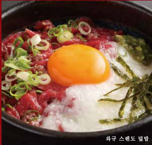
와규 스텐도 덮밥