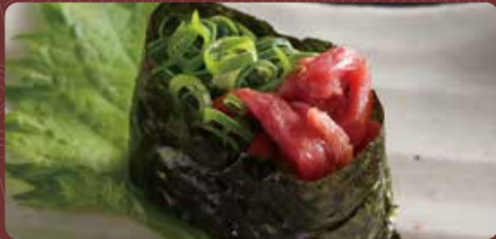
스렌도 군함 스시 1개분 350円