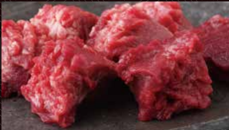
코리코리탄 (혀끝) 한덩어리 180 円/반 350 円/1인분 650 円