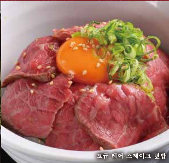
고급 레어 스테이크 덮밥