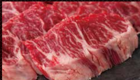
상금 하라미 (안창살) 한덩어리 480 円/반 950 円/1인분 1,800 円