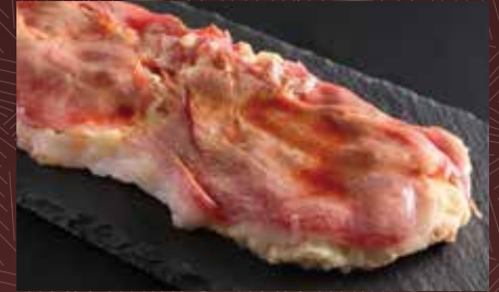
고쿠멘의 대형 감자 샐러드