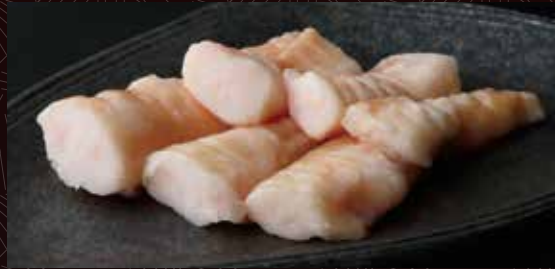
마루 초 (소장)