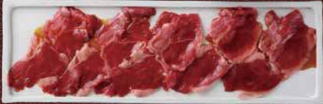
치마키 (사태고기) 1,000원

팔과 다리의 스키 부분의 고기입니다. 맛이 응축되어 탄력성이 풍부한 고기입니다.